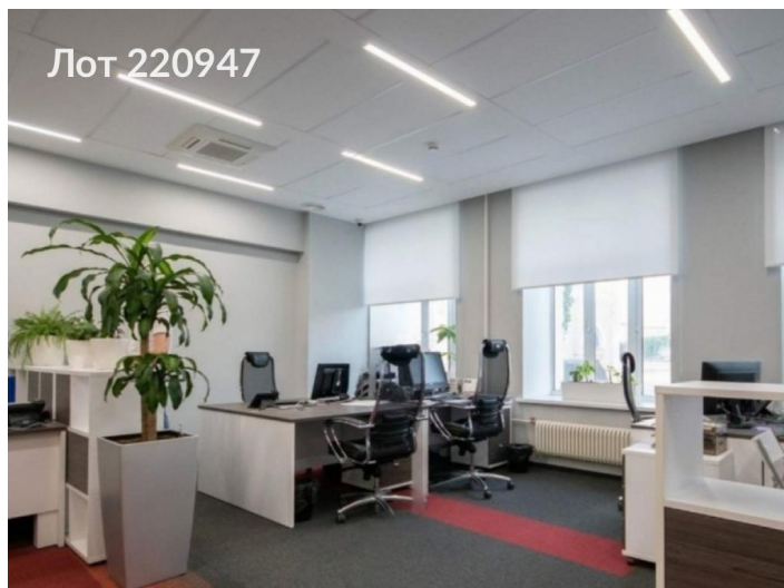
Подвальное помещение Площадь 146,8м 2